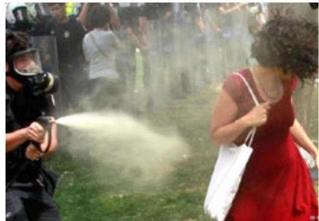
28 Mayıs 2013