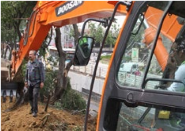
28 Mayıs 2013- Sırrı Süreyya Önder