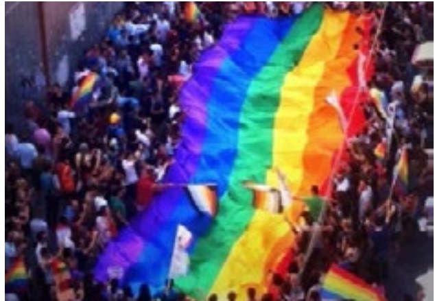
Kırmızıyı Çoklayan An'lar