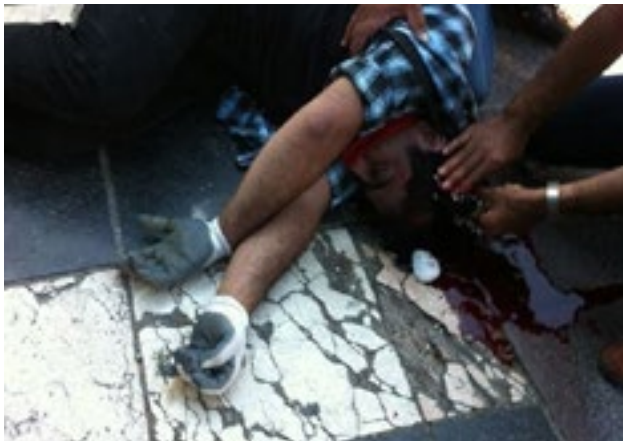
31 Mayıs 2013, Taksim / 1 Haziran 2013, Kızılay

kırmızının bin bir tonuyla karşılaşmak düşündürüyor işte; kırmızı, kan, devrim ve şiddet üzerine, yeniden, yeniden. Kırmızı.