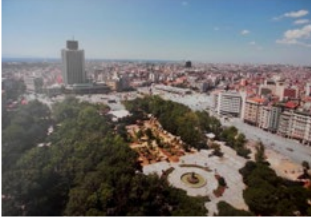
Resim 2. Gezi Parkı'na polis müdahalesinden sonra uzunca bir süre halkın kullanımına kapatılan park alanı görülüyor. (Fotoğraf; Ozan Güzelce, Milliyet Gazetesi, Haziran 2013)

ABD ve Fransa örneklerinde olaylar varoşlarda başlamış, toplumun alt gelir grubu olarak tanımlanan, fiziksel nitelikleri son derece kötü evlerde oturan, marjinalleşmiş grupların içerisinde patlak vermiş ve yayılmıştı. Dolayısıyla bu isyanları "varoş" ayaklanması olarak ifade etmek yanlış olacaktır. Ancak Gezi Parkı ise gerçekten bir kamusal alanda ortaya çıkan ve dalga dalga yayılan dolayısıyla "park" isyanı olarak nitelenebilecek çok farklı karakterde bir olaydır. Bu harekete katılan toplulukların içerisinde birçok gelir grubuna giren, farklı eğitim seviyelerinde, hayata ve çevreye bakışları farklı binlerce insan bulunmaktaydı. Bu farklı toplulukların aynı amaç doğrultusunda bir araya gelişleri ise Gezi olaylarını Los Angeles ve Paris ayaklanmalarından ayıran belki de en temel özelliğidir.