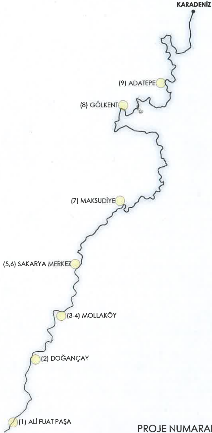
PROJE NUMARALARI ve ÇALIŞMA ALANLARI