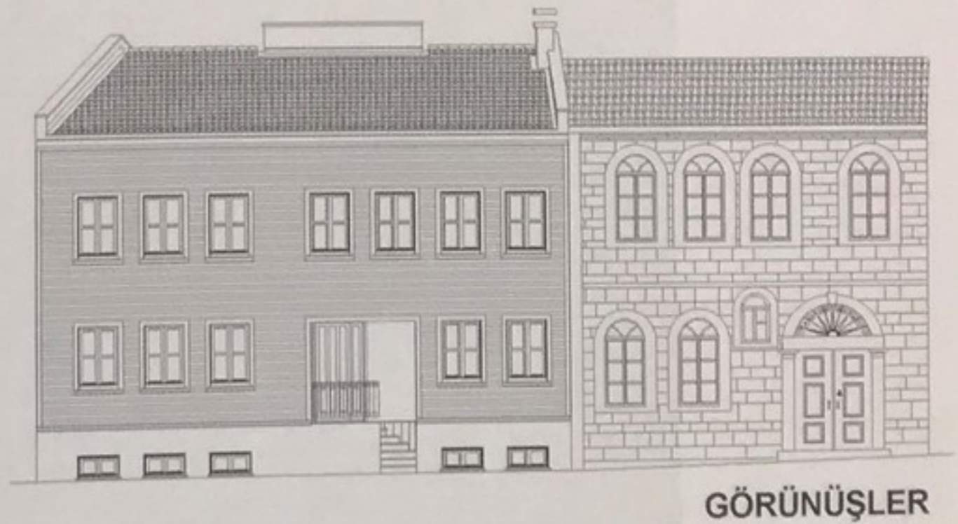
Şekil 4. Balıkesir Valiliği tarafından restore edilmek koşuluyla Balıkesir Sanat Fotoğrafçıları Derneği'ne tahsis edilen Ulus Sokak, 2 nolu Pafta, 2 nolu Ada ve 20-21 parsellerde birlikte yer alan taş ve ahşap yapılar.