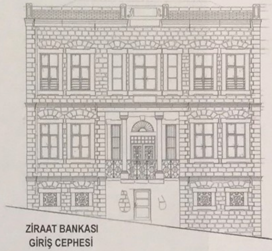
Şekil 3. Kâzım Özalp Sokak girişinde ve Saat Kulesi'nin karşısında bulunan 5 nolu Ada ve I nolu Parselde yer alan, Ziraat Bankası'na ait taş yapının ön cephe çizimi.