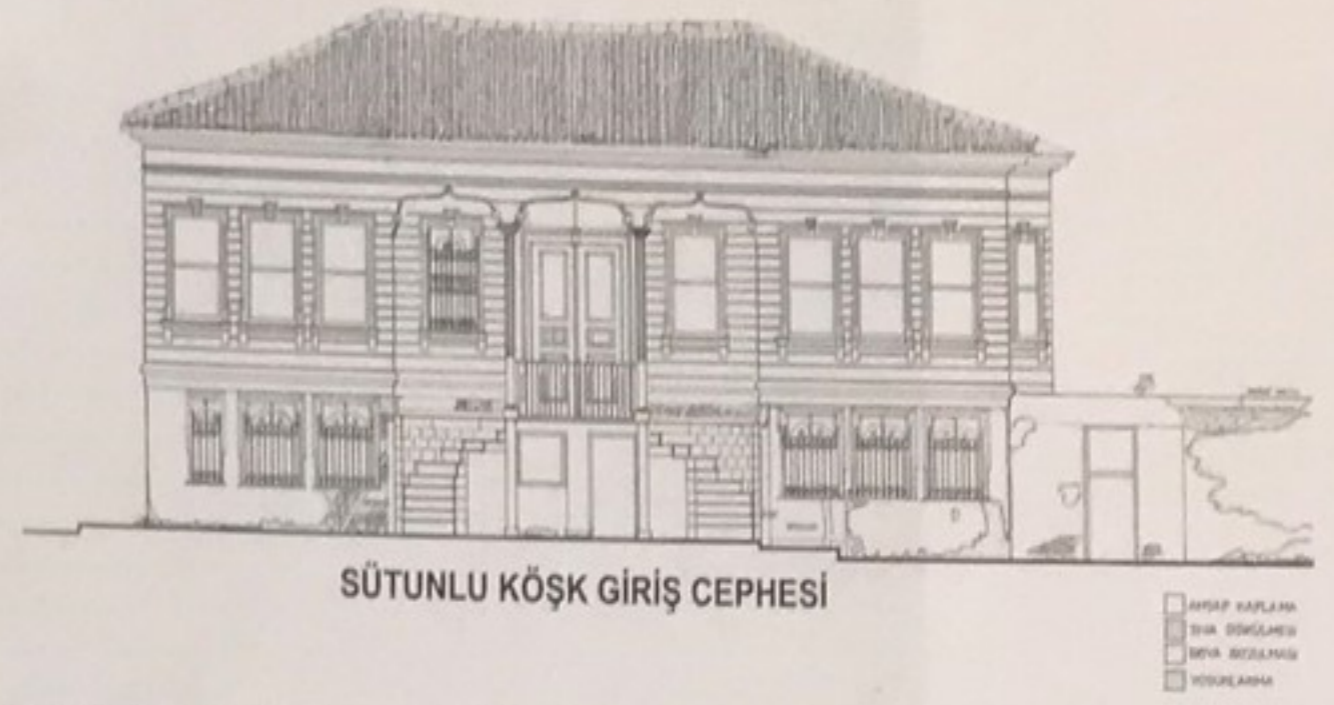
Şekil 2. Kâzım Özalp Sokak'ta bulunan ve Sütunlu Köşk olarak bilinen ahşap yapının Balıkesir Üniversitesi Mimarlık Bölümü Restorasyon Ana Bilim Dalı tarafından gerçekleştirilen röleve projesi.

Yapıların planları incelendiğinde şu özellikler dikkat çeker. Genellikle iki yanında odaların bulunduğu orta sofalı bir mekân örgütlenmesine sahip yapıların bazılarında, zemin kat ile üst kat arasında küçük bir galeri veya odalardan oluşan, bütün katı kaplamayan, diğer bir deyişle zemin katın devamı niteliğinde bir ara kat bulunur. Üst katların yaklaşık % 88'i çıkmalıdır. Dolayısıyla yaşama mekânı olan üst katların genişletilmeye çalışıldığı dikkati çeker. Ancak buna rağmen geleneksel sivil mimari dokusunda çatı katı veya çekme katlara rastlanmaz.