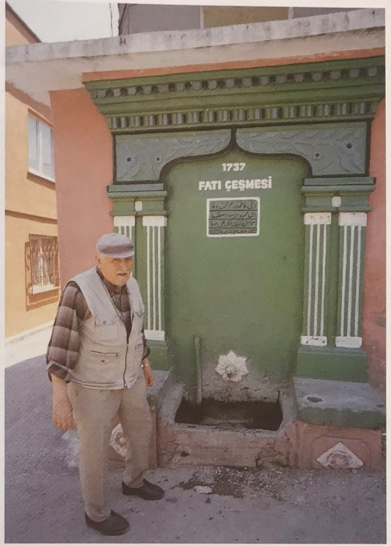
Fatı Çeşmesi.

Bu bölgede yer alan sivil mimarlık örneklerinin genel özellikleri ise şu şekilde özetlenebilir: Yapılan araştırma sonuçlarına göre, bu bölgelerde korunacak sivil yapıların ortalama parsel büyüklüğü 155,2 m 2 , bina büyüklüğü ise 88.1 m 2 , ortalama katsayısı 2 olarak belirlenmiştir. Bu yapıların %13'üne bahçeden, % 87'sine ise sokak üzerindeki giriş kapısından girilmektedir. Konut yapıların % 80'e varan çoğunluğu ahşap yapılardır. Bu yapılarda taşıyıcı sistem olarak ahşap çatıklar, dolgu malzemesi olarak ise tuğla, kerpiç ve moloz taş kullanılmıştır. Çoğu iki katlı olan bu yapılar arazinin eğiminden ötürü, açıkta kalan bodrum katlar üzerine inşa edilmiş, bu bodrumlar moloz taş malzeme ile yığma olarak yapılmış ve ahşap hatıllarla desteklenmişlerdir. Zemin katlar genellikle giriş katı olarak düzenlenmişlerdir. Zemin katlar, ağırlıklı olarak ahşap iskelet ve dolgu duvarlarla oluşturulmuş olmasına rağmen bazı yapılarda bodrum kat duvarlarının devamı şeklinde moloz taş malzeme ile yığma olarak yapılmışlardır. Zemin kat duvarları ve üst kat bölünmeleri ahşap iskelete göre biçimlenmiştir. Bu ahşap iskeletin üzeri ahşap bağ-