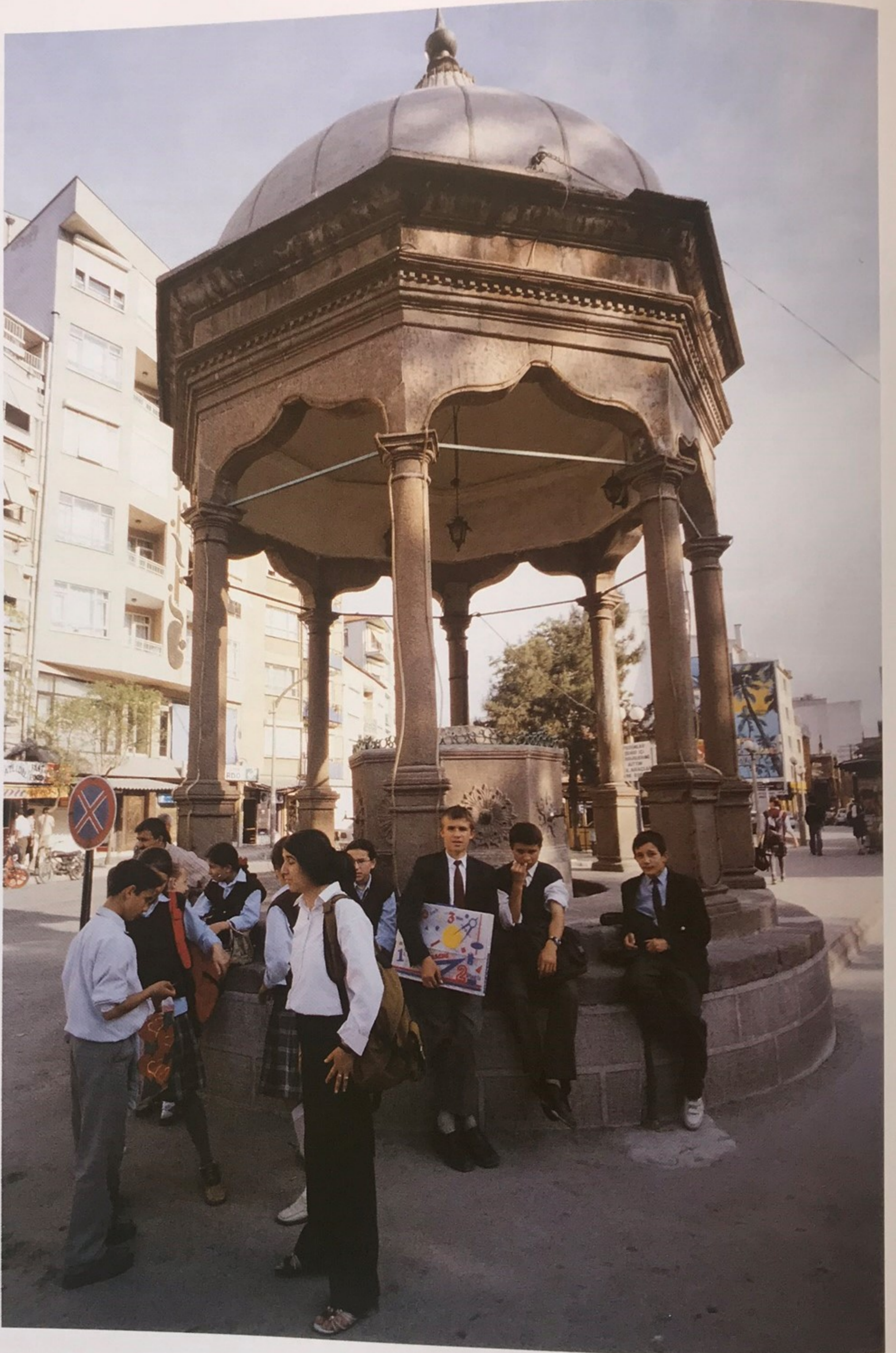
Şehir merkezindeki şadırvan.