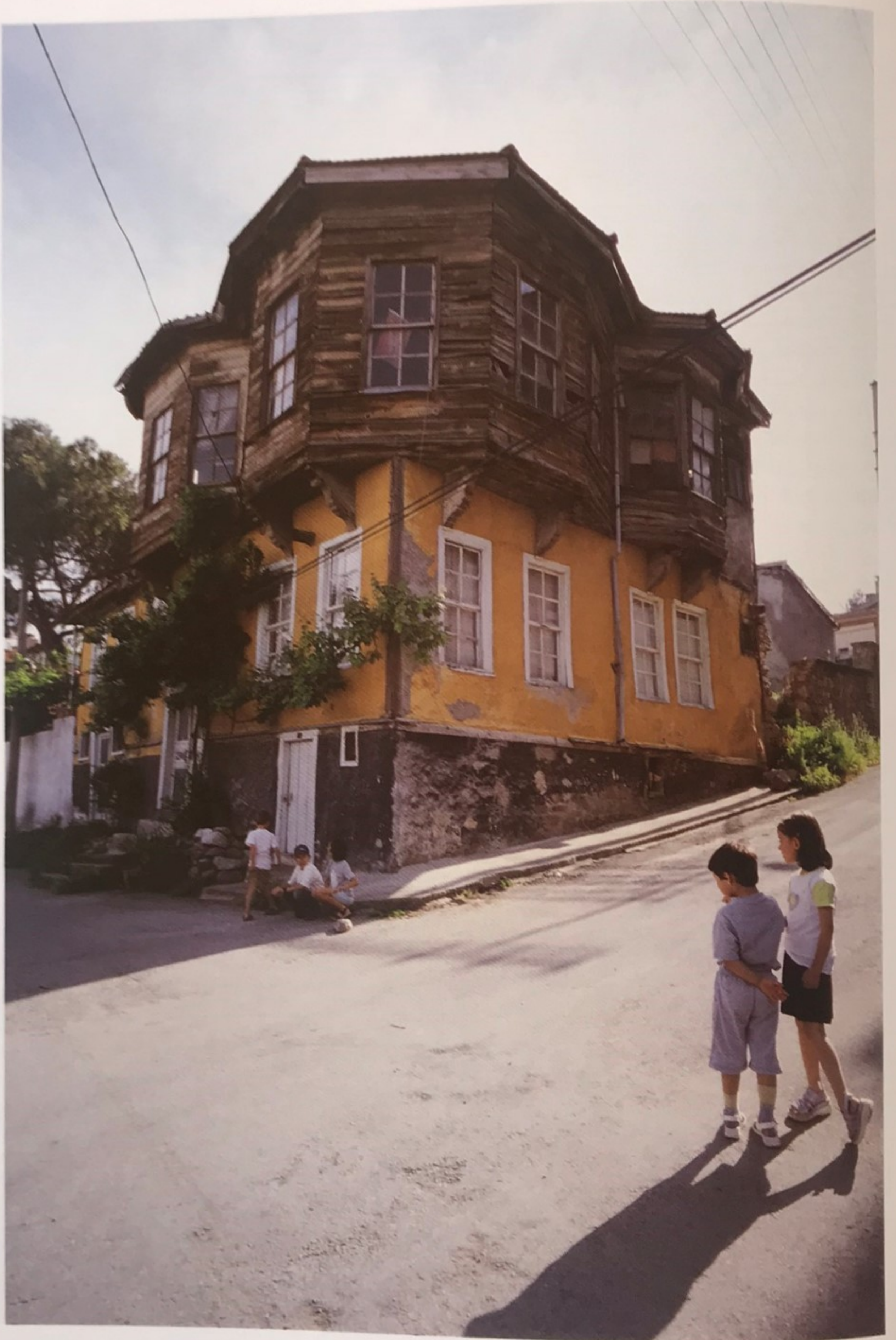
Sivil mimariye bir örnek.