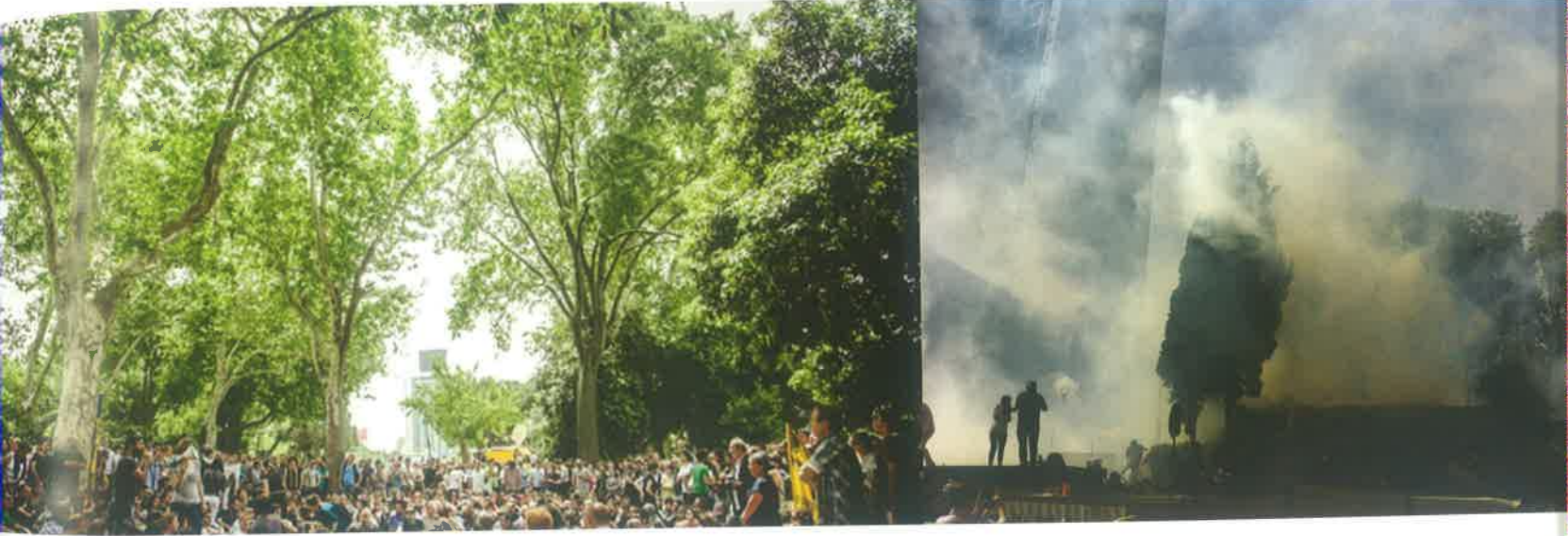
Şekil 3: Mekânsal Mücadele