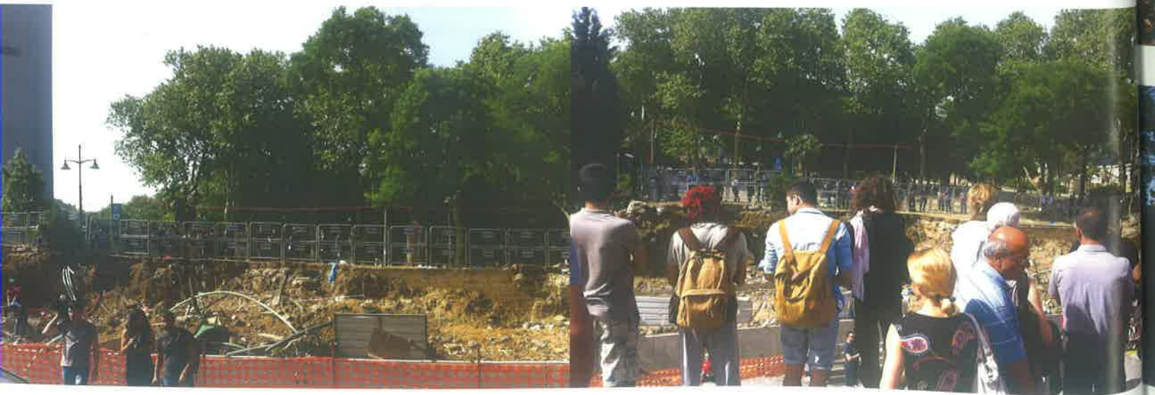
Şekil 2: Boşaltılan ve Kuşatılan Gezi Parkı