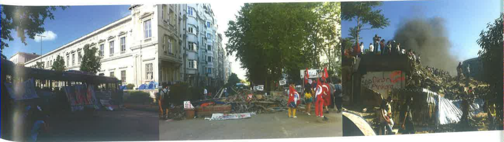
Şekil 4: Mekânsal Mücadeleye Ait İzler; Barikadlar