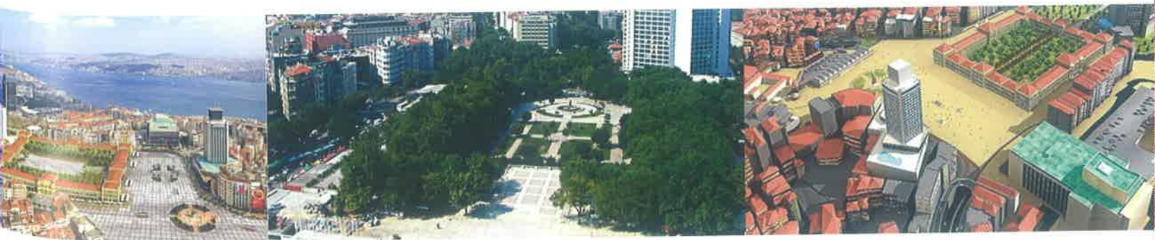
Şekil 1: Mevcut Kamusal Alan ve Mimari Müdahale Önerisi

Öyle görünüyor ki sanal aleme, kapalı mekânlara, özellikle de AVM'lerdeki yapay-steril ortama kendini kaptırdığını düşünerek ümit kestiğimiz toplumsal tabakalar (ki buna hepimiz dahiliz) yeterli doyumluğa ulaşmışlar ve vaktiyle ötekileştirdikleri diğer tabakaların çok daha fazla ihtiyacı olan kamusal bir alanın gaspına engel olmak üzere onlara destek olmaya karar vererek, tekrar açık alana, kamusal alana, yani kentsel alana inerek, sadece kendileri değil 'herkes' için 'kent hakkı' arama mücadelesini vermeye karar vermişler. Bu yazıda Gezi Parkı olaylarını mimari ve kentsel tasarım bilgi alanı içinden bu yönde okuyacağım ve tahminimce bu okuma başkalarının da teyid edilebilecek nitelikte 'kesin bilgidir'. Bu kentleşme tarihimizde de önemli bir kırılma noktası olacaktır kuşkusuz... (Şekil 1).