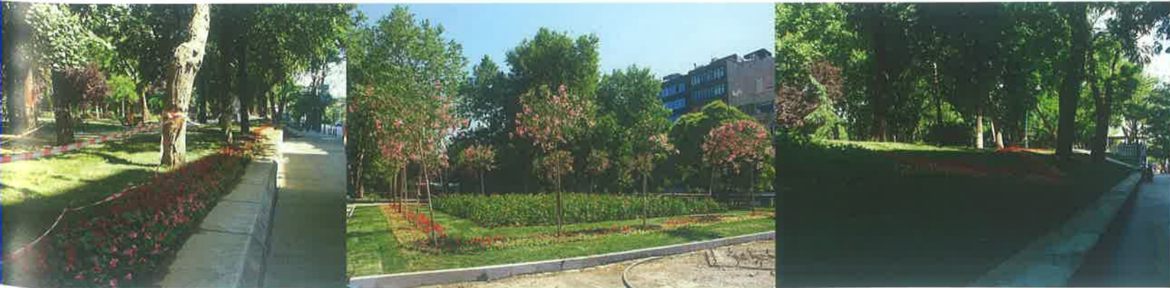
Şekil 7: İnsansız Kent Parkı