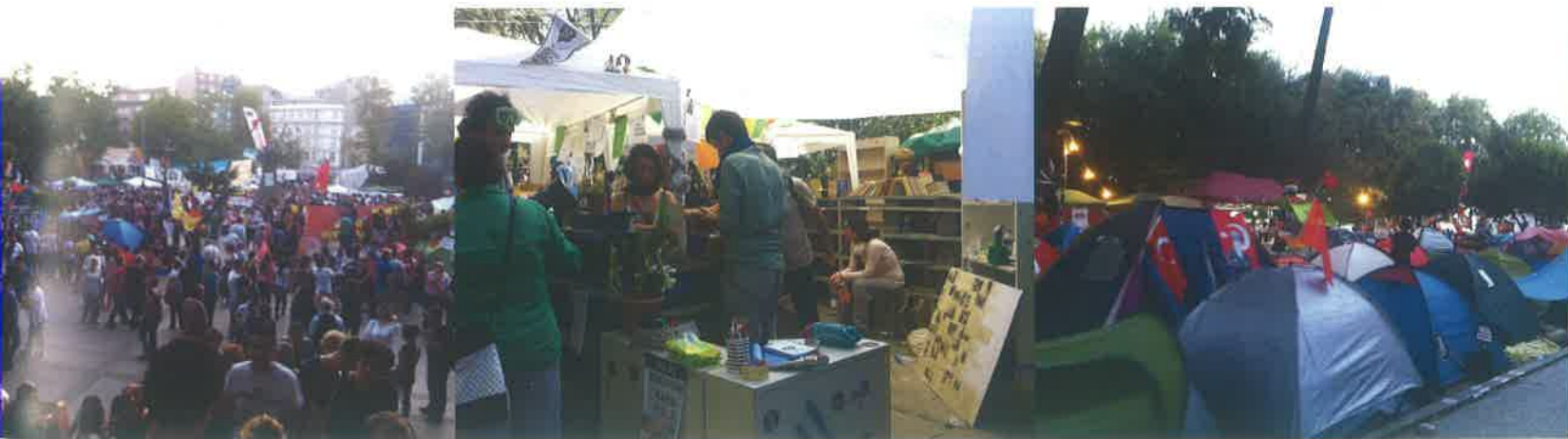
Şekil 6: Esnek Kentsel Planlama Modelleri için bir Laboratuvar

Bu olaylar siyasi açılımlarının yanı sıra mimarlık ve kent bilimi üzerinden bakıldığında bize şunu göstermiştir ki yeni kuşaklar artık kentsel mekânlarına sahiptir.