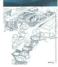
12. Sayı Kapak Konusu Sevinç - Şandor Hadi İstanbul Üniversitesi Kütüphanesi

Cumhuriyet Bulvarı 2. Kordon 209/4 Alsancak 35220 İzmir +90 232 4631630 (tel) +90 232 4631057 (faks) www.izmir-smđ.org.tr