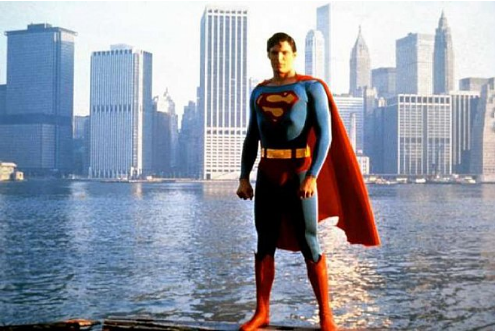
Şekil 1. Süpermen-Süper Kapitalizm – Süper Kentleşme

"Süper kahraman" kavramı ve modernite (Reynolds, 1992) arasındaki ilişkiye dair ilginç ve kapsamlı bir literatür mevcut. Bu bağlamda, 1930'ların başında (esasen "şeytani telepatlar" olarak yaratılan bu kahramanlar (özellikle de Süpermen) çok kısa zamanda yaygınlaştırılması amacıyla iyi kahraman figürüne dönüştürülerek piyasaya sürüldü, 2. Dünya Savaşı sırasında konjonktürel olarak yükseltildi ve özellikle savaş sonrası ortamında ise olabildiğince pompalandı. Bir süper kurtarıcı figürünün kökenleri mitolojiye ve dini figürlere kadar uzandırılabilir kuşkusuz. Ancak süper kahraman fikrinin kapitalizm ile tomurcuklanacağı bir zemin bulunduğunu söylemek de yanlış olmaz çünkü süper kahramanları doğuran tek şey adaletsizlik duygusudur. Dünya siyaseti ve ekonomisindeki gelişmelere bağlı olarak da özellikle 80'lerin sonlarından itibaren "süper" kelimesi her kavramla ilişkilendirildi ve yüceltilmek (ve daha yüksek bedellerle pazarlanmak istenen her varlık için adapte edildi). Kentler de bundan payını alacaktı kuşkusuz. Sınıfsal ayrışmanın ve çatışmanın temel temalarından olan kentli-taşralı çelişkisi de bu körüklemenin rüzgarında giderek büyüdü. Bu anlamda "süper-kentler" dosyaları serisinin adındaki bu süper-kent terimi, kentleşmemizdeki (bir anlamda da modernleşmemizdeki) problemin özünü ortaya koymak açısından oldukça anlamlı ve bir o kadar da hassasiyetle ve eleştirel olarak kullanılması gerekli bir terim.