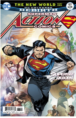
Şekil 2. Süpermen