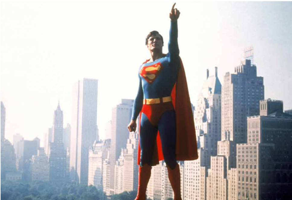
Şekil 6. Süper Belediyeçilik

Bu kapitalist arz mekanizmaları, çocukla ilgili sektörlerde geliştirdiği enstrümanların benzerini "süper" etiketini yapıştırdığı tüm ürün ve kavramlarda da uygulamaktadır kuşkusuz... Bir çocuk kendini süper bir kahraman gibi hissedebilmek için nasıl ebeveynlerine bu ürünlerden satın almaları yönünde dayanılmaz baskılar uyguluyorsa, kent yöneticileri de kentlerini "süper" yapmak için (Şekil 5) seçmenlerine ve hatta seçmeni dahi olmayan halka (yollar, binalar, AVMLer üst ve alt geçitler, bat-çık geçitler, kentsel dönüşümler ve TOKİler vs. gibi) tüm kentsel oyuncakları gerekli-gereksiz dayatmak için her yöntemi kullanmaktadırlar. Kentliler olarak bizler de kent yöneticilerimizin bu heveslerini (aynı yukarıda ebeveynlerin durumunu ifade ettiğim gibi) kırma gibi demokratik bir şansımız olmadığından kendimizi bu istekleri karşılarken buluruz. Ancak bu kez bir çocuğun hayaller dolu zihninden ve evimizin kontrollü sınırlarının dışındayızdır, kamusal alandıdır, artık durum o kadar zararsız ve kabullenilir nitelikte değildir aslında; ama biz tüm kontrolü, kaynaklarımızı ve yaptırım gücünü bu kez bu hayalleri kuran kişiye bırakmışızdır. Tam da bu noktada süper-kent ve süper-belediyeçilik ilişkisine bakmak anlamlı olacaktır (Şekil 6).