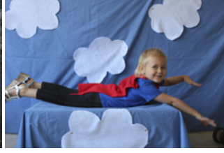
Şekil 4. Çocukların Fantezi Dünyası ve Süpermençilik

Süper-men ve benzeri süper güçlere sahip kahramanlar öncelikle çocuklara gençlere yönelik comic-book niteliğinde işler olarak ortaya çıktı (Şekil 2). Bilindiği üzere hemen her çocuk kimlik oluşturma döneminde bir süper kahramanla kendini özdeşleştirir (Bender, 1944) ve bu eğilimin eğitimde olumlu şekilde kullanılabileceği görüşünü savunan pedagojik ekoller mevcut (Rubin, 2007). Stradan insan gibi görünen ancak olağan ötesi güçlerini kullanarak insanlığı kötülerden kurtaran kahraman figürünün benlik inşasında sıkıca tutunulan bir model haline gelmesi hiç de şaşırtıcı değil. Ancak, bu çocuksu tutku, kapitalizmin iştahını öylesine kabartır ki bu ilgiyi sömürerek ekonomik bir değere çevirmekle kalmayıp onu idolleştirerek sürekliliğini sağlamak için tüketim araçlarını tüm gücüyle seferber ve arz eder. Bu doğrultuda, t-shirtten şapkaya, pelerinden full-kostüme, oyuncaktan yatak örtüsüne, filminden ve bilgisayar oyununa, pek çok satın alınabilir araçla çocukların süper kahraman olma arzusunu tahrik eder (Şekil 3).