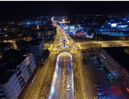
Şekil 8. Balıkesir Kuvayı Milliye Alt Geçidi

Bu üst ölçekli planlama dönüşümünün kentin gündelik hayatına doğrudan etki eden (ve yaşamın boğurine saplanan) unsurlarından ikisi üzerinde durmak bu yazının argümanını net biçimde somutlaştıracaktır. Birincisi, inşaatı boyunca kente girişi, kulağını diğer yandan gösterircesine uzatan Kuvayı Milliye Alt Geçidi (Şekil 8), inşaatı tamamlandıktan sonra da "attığı taşın ürküttüğü kuşa" değil değmediği sorgulanır bir trafik akrobasisi getirmenin ötesinde katkı sağlamadığı gibi, etraftaki yaya hayatını tamamen bitirmiş ve aslında orada daha önce inşa edilen AVM'nin de idam hükmünü vererek kalan ömrünün geri sayımını başlatmıştır. İkincisi ise, Vasıf Çınar Caddesinin Bursa yönü şeridindeki şehir dışına yönelen trafikten, Yeni Hastane Caddesine gidecek trafiği ayırmak (gibi yoğunluğu çok da fazla olmayan bir trafik düzenlemesi) için neredeyse tek şeritlik ama o ölçek için oldukça abartılı bir viyadük düzenlemesi haline gelip, diğer yöndeki kente giriş trafiğini ise bir sonraki döner kavşakla ilişkisinin yanlışlığından ötürü olduğundan fazla yoğunlaşırın 15 Temmuz Şehitleri Üst Geçidi (Şekil 9). Diğer alt geçidin ardından tüm işe yaramazlığı ile bu üst geçit, yazı boyunca anlattığım, kentini viyadüklerle dolu bir metropolmiş gibi görmek ve göstermek isteyen bir süper kahramanın fantezi dünyasının halkın kamu kaynaklarıyla (ve üstüne borçlandırılarak) hayata geçmesinin ikonlaşmış objeleridir.