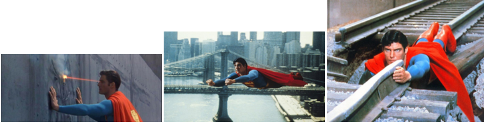
Şekil 5. Süpermen ve Süper Altyapı Hizmetleri