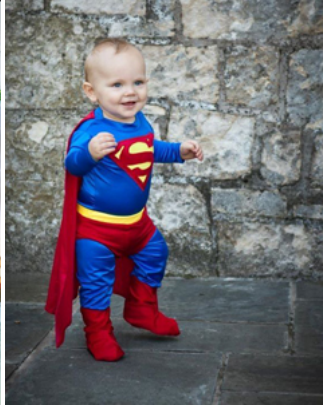
Şekil 3. Süpermen tüketiciliği