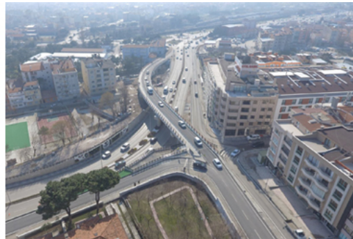
Şekil 9. Balıkesir 15 Temmuz Şehitleri Üst Geçidi

Yakın zamana kadar trafiği görece sakin bir kentten ve İstanbul'a geldiğinde trafik yoğunluğuna şok içinde bakan kentli profilinden, bugün, şehre kuzeyden girerken önce kent girişindeki AVM'nin önünde yer altına dalan daha sonra ise şehir girişinde kendilerini karşılayan büyük otelin önünde çeşitli kotlarda sıkışan trafiği olağanlaştıran bir kent ve kentli profiline kaydırılmıştır Balıkesir. Artık araç odaklı bir kent olarak tescillenmiş sayılabilecek kentler arasına katılan Balıkesir'de kentli sessizce "Trafik de çok yoğunlaştı canım..." diye sızlanmanın ötesine geçemeyerek, atlattığı bir üst sınıfın bedellerini usulca (ve usluca) ödemektedir.