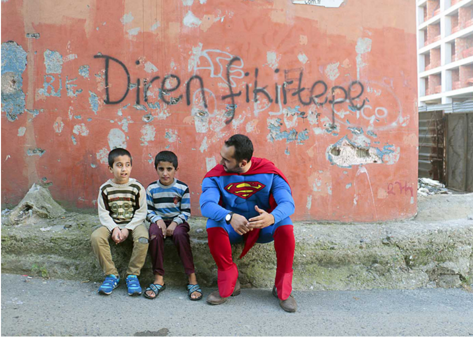
Şekil 10. Süpermen Belediye Başkanı Figürünün iflası